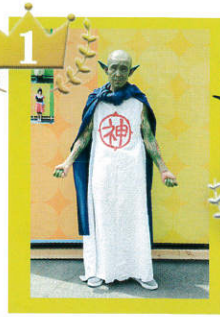
本格的に全身ペイント!

告知のチラシでもお知らせをし、ご来場の皆様に自由に仮装をして来て頂き、受付で会場エントリー♪職員や利用者も仮装して参加した人も!エントリーして頂いた方のお写真を撮らせて頂き投票で順位を決めて、最後に舞台上で順位を発表!入賞者には景品も(^_^)♪皆さん素敵な仮装で大いに会場を賑わせて頂きました♡ご参加下さった皆様ありがとうございました!