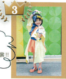
なんと手作り衣装!!