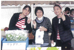
水耕栽培の野菜販売