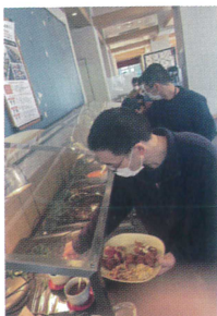
何を食べようかな!