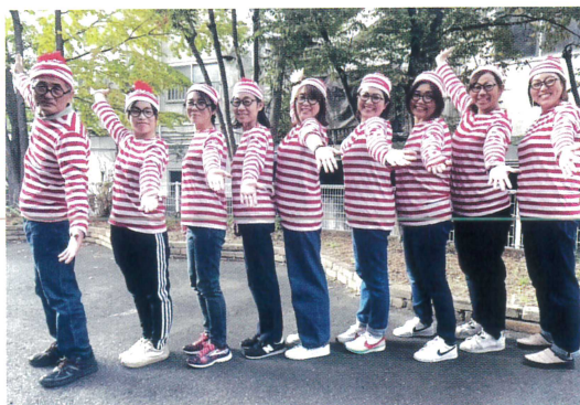
●団体：母屋／ウォーリーを探せ