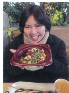
美味しそうなローストビーフ丼