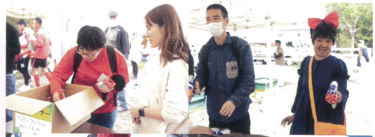
ボランティアさん/ゲームコーナー