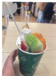
こう見えてホットドリンクです