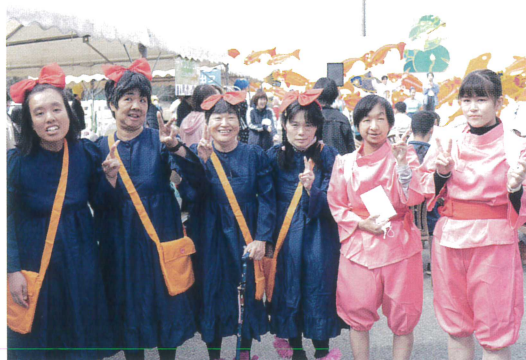
●団体：三木光司園 ホームにっこり ／魔女の宅急便 千と千尋の神隠し