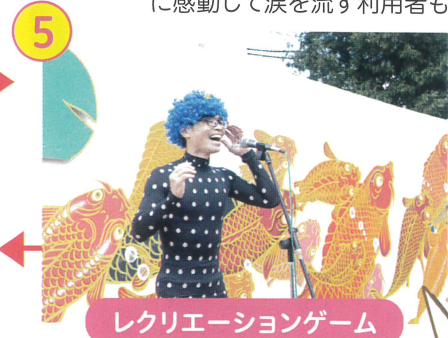
レクリエーションゲーム

「まほろばのつどい」ステージで、ゲームのお兄さんを務めさせていただきました。皆さんが温かく盛り上げてくださったお陰で、拍手ゲームや落ちた落ちたゲームなど、一緒に盛り上がって、すごく楽しかったです。まほろばラブ!