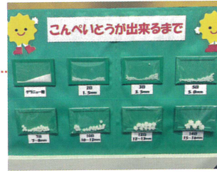
1日かけて1mmしか大きくならない