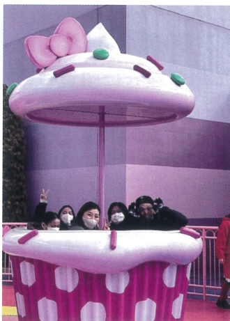
キティちゃんのカップケーキドリームでポーズ!!