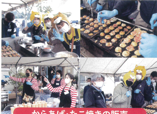
からあげ・たこ焼きの販売