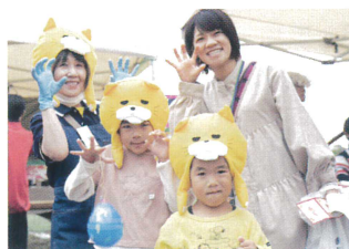
★職員のご家族も参加してくれました