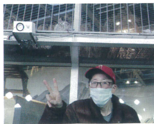
ホワイトタイガーもいました