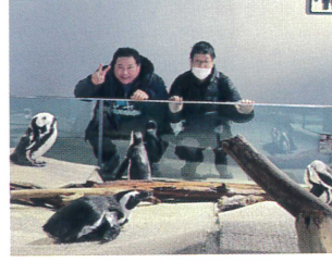
かわいいペンギンたちとハイチーズ