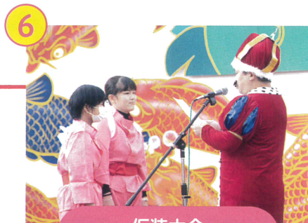
仮装大会 結果発表&表彰式

「まほろばのつどい」ステージで、ゲームのお兄さんを務めさせていただきました。皆さんが温かく盛り上げてくださったお陰で、拍手ゲームや落ちた落ちたゲームなど、一緒に盛り上がって、すごく楽しかったです。まほろばラブ!