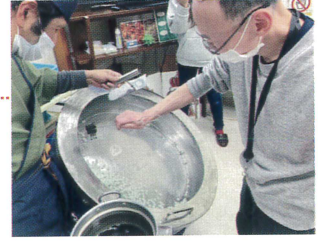
コンペイトウ手作り体験♪