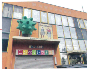
コンペイトウミュージアム