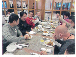
さあ、ランチバイキングです