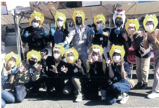
●団体：ウェルフェアまほろば／ノラネコぐんだん