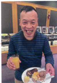
スイーツもたくさんありました