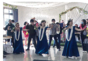
最後はみんなで踊りました