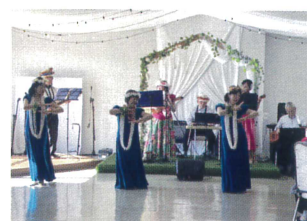
フラダンスとバンド