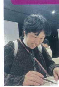
カバちゃんの塗り絵コーナー