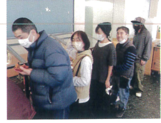
お料理渋滞中です!