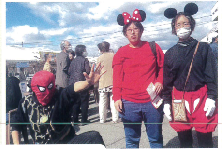
テーマ “ひとつになって、たすけあいの輪をひろげよう!”