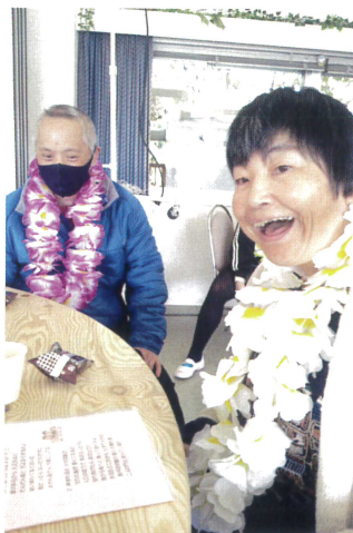
ハワイの首飾り “レイ”