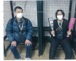
ロッカールームも入れました!