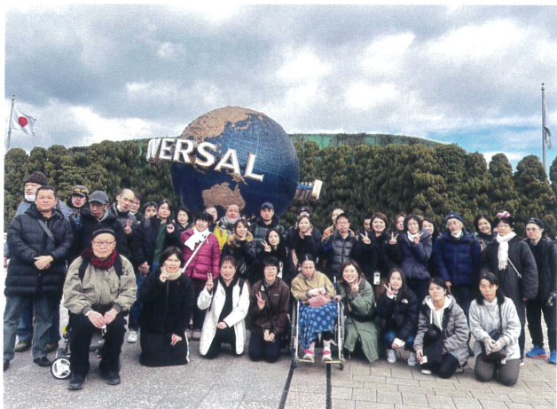
いまから楽しむぞー!

令和6年1月27日(土)日帰り旅行に行ってきました。行き先は、ユニバーサルスタジオジャパン。3つの候補地からアンケートをとり決定しました。総勢37名(利用者21名・引率16名)大型バスで8:30出発です。1月という事もあり天候など心配していましたが、天気にも恵まれグループごとに楽しみました。グループ分けも工夫し、絶叫系に乗れるグループ・ショーアトラクショングループ・パレード見学グループなどそれぞれ楽しみました。ケガや体調不良者、迷子などもなく予定通りに帰宅出来ました。帰りのバスは疲れて無言になるかと思いましたが、USJの思い出話でもちきりでした。また、お仕事を頑張り余暇活動(旅行など)も全力で楽しむメリハリのある生活をしていきたいですね。