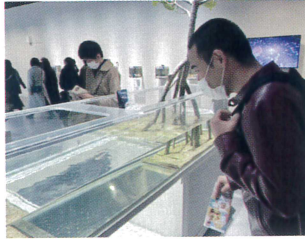
水槽の中に興味津々